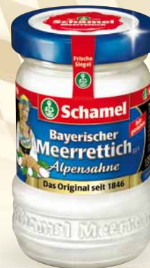
Schamel Meerrettich Alpensahne fein gerieben