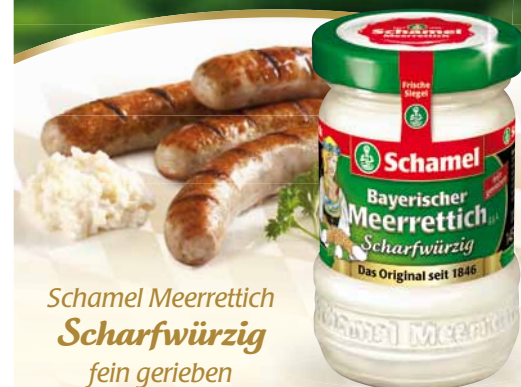
Schamel Meerrettich Scharfwürzig fein gerieben

Bayerischer Meerrettich mit 100% Herkunftsgarantie