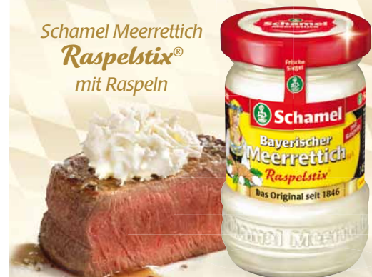
Schamel Meerrettich Raspelstix® mit Raspeln