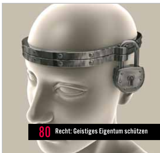
80 Recht: Geistiges Eigentum schützen