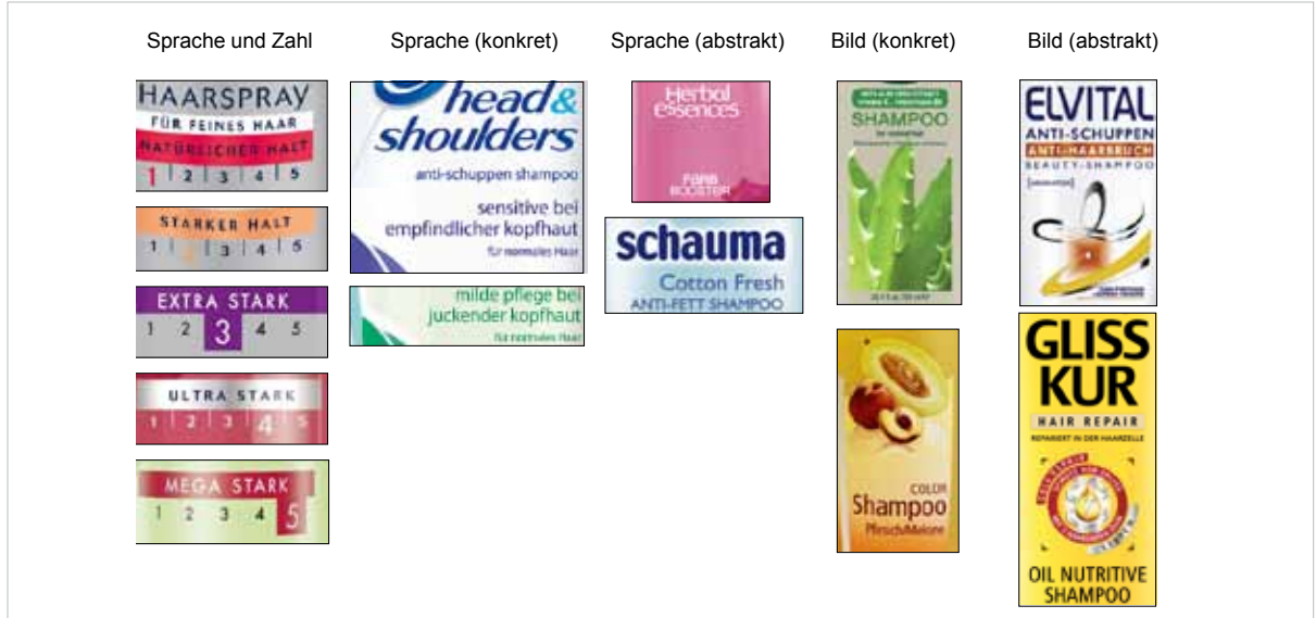
Damit sich ein Produktsortiment erschließt, sollte die Benennung der einzelnen unter einer Marke geführten Produkte verständlich, klar und trennscharf sein. So tragen die Haarstyling-Produkte von 3 Wetter Taft aufsteigende Zahlen je nach Intensität des Halts.

Entscheidend für den Erfolg einer Dachmarkenanbindung ist eine hohe Markenstärke, die Relevanz für die zu markierende Produktkategorie sowie der wahrgenommene Fit. Zur optimalen Wahrnehmbarkeit der Anbindung sind neben dem Logo auch die Verpackung und die Kommunikation entsprechend zu gestalten. Dabei gilt es, den Spagat zwischen Synergie und Eigenständigkeit erfolgreich zu managen, das heißt einerseits die Eigenständigkeit der Marke zu bewahren, andererseits jedoch die Anbindung an die Dachmarke deutlich zu machen. Ferner muss die vertikale Struktur der Forderung nach »Mental Convenience« gerecht werden, das heißt logisch und verständlich sein.