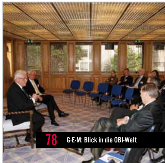
78 G-E-M: Blick in die OBI-Welt