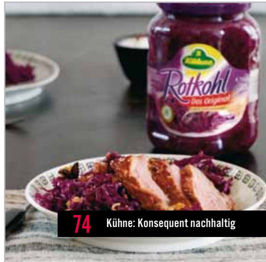
74 Kühne: Konsequenz nachhaltig