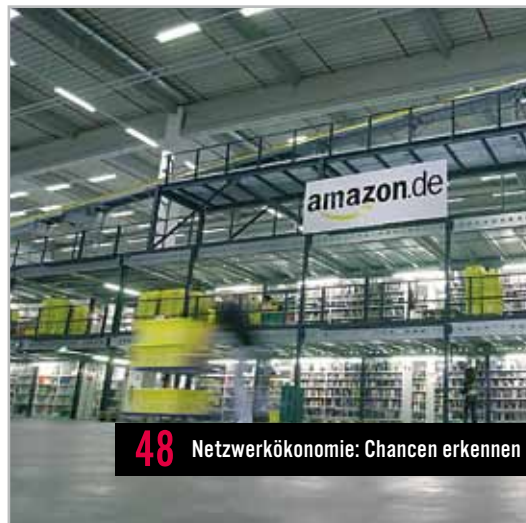
48 Netzwerkökonomie: Chancen erkennen