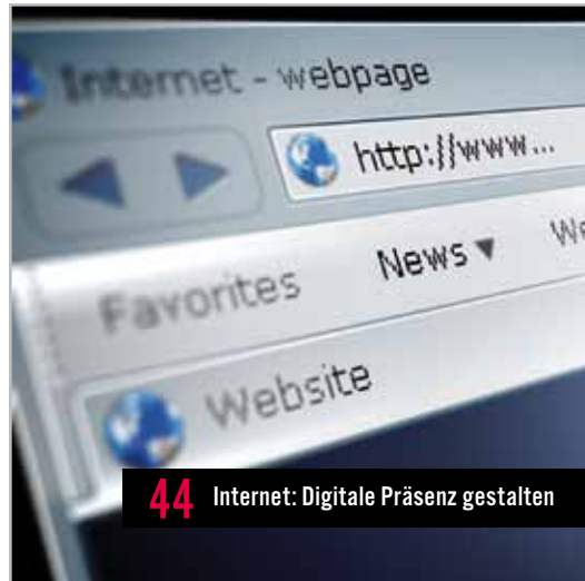
44 Internet: Digitale Präsenz gestalten