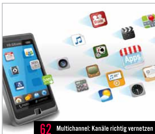
62 Multichannel: Kanäle richtig vernetzen